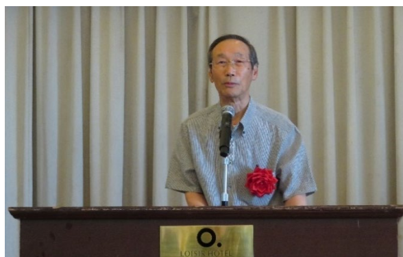
（清水会長挨拶を代読する賢木副会長）