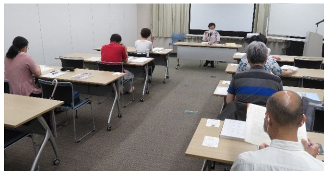
(共通科目研修の様子)

5月21日から23日、補償業務管理士共通科目研修が自治会館にて行われました。受講生は7名でした。10月の筆記試験に向け頑張ってください。