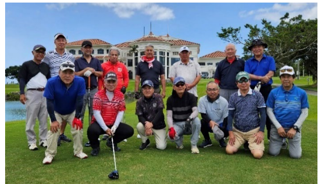
（スタート前集合写真）