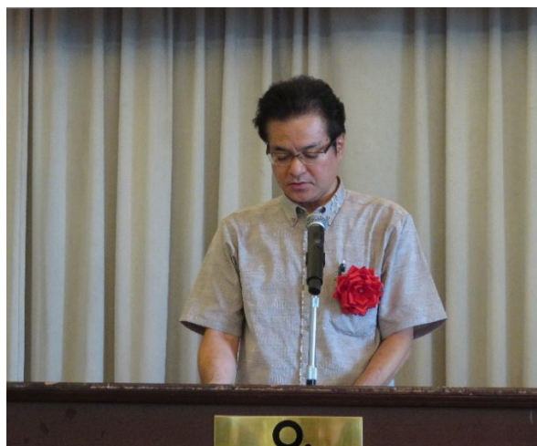
（河南次長挨拶を代読する伊波用地課長）