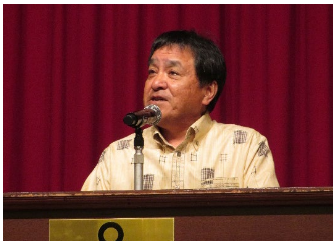
懇親会で挨拶を行う比嘉新支部長