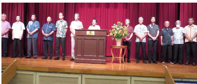
(懇親会での新役員等の紹介)