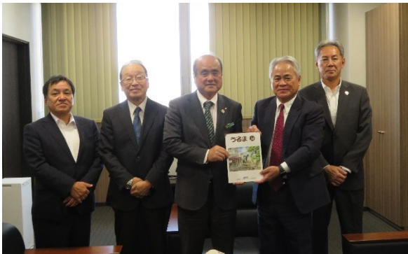
〈左から3人目が友寄大宜味村長〉