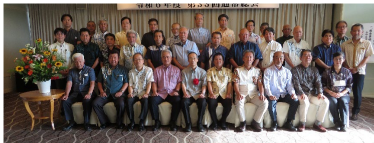
（総会後の記念撮影）