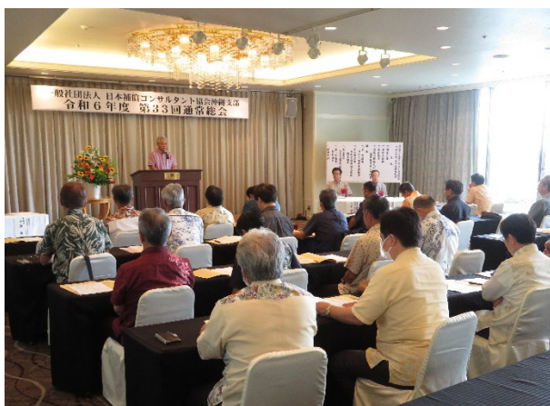
（小濱支部長挨拶の様子）