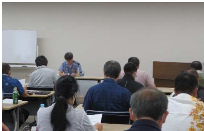
(講師：富澤課長補佐)