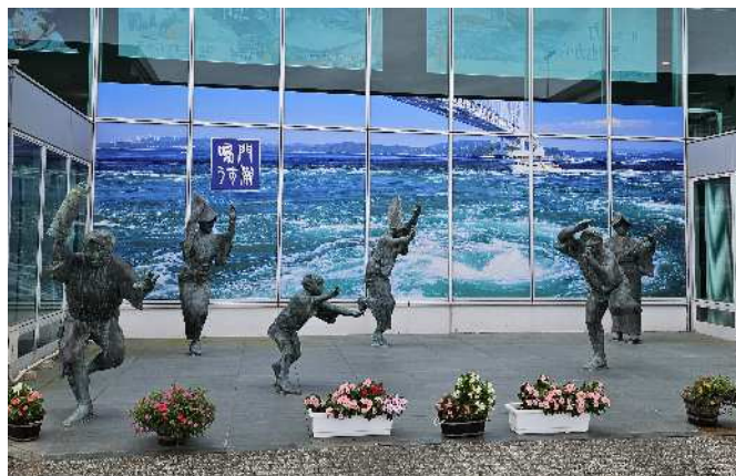
(徳島阿波おどり空港)