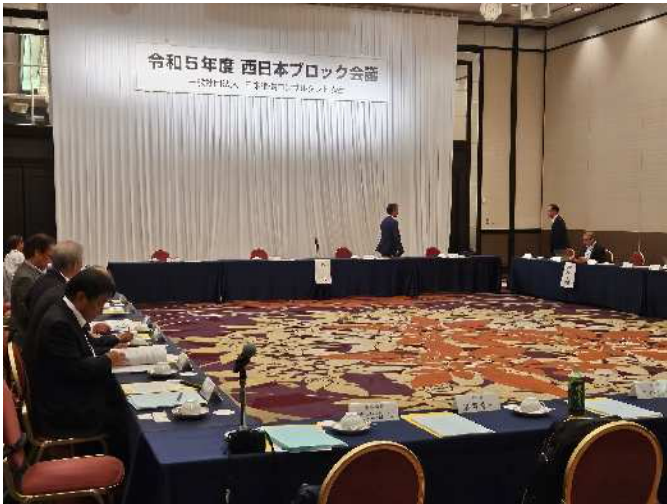
(会場：JR ホテルクレメント徳島)