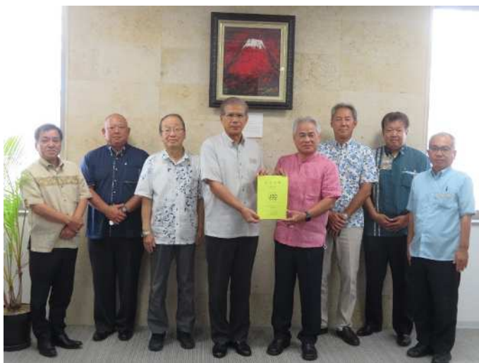
〈左から4人目が新垣八重瀬町長〉