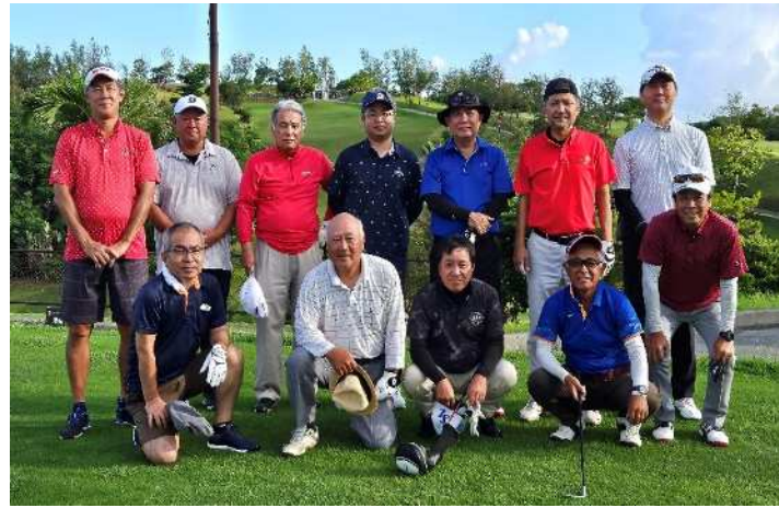
(スタート前集合写真)