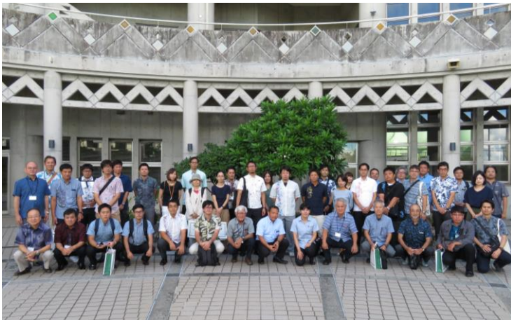
受講生との記念写真